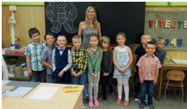
Prvnáčky ze ZŠ Černá v Pošumaví ve školním roce 2020/2021