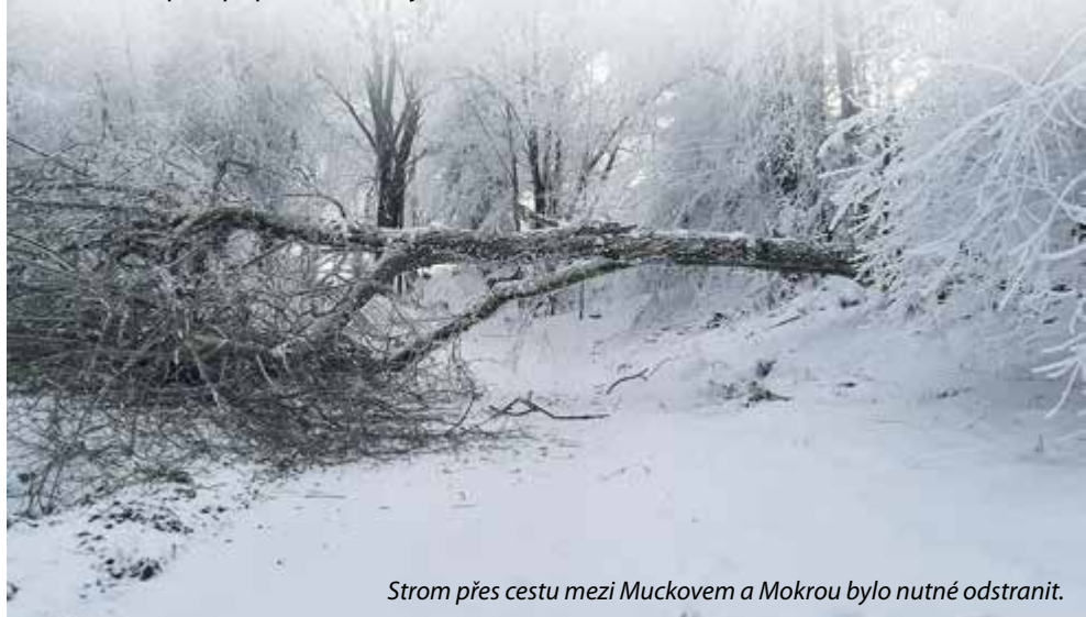
Strom přes cestu mezi Muckovem a Mokrou bylo nutné odstranit.

Mezi výjezdy část z nás stihla 4. února zdravotní školení na stanici HZS Frymburk a to ve spolupráci s jednotkami obcí Loučovice, Přední Výtoň a domácím Frymburkem. Školil nás zdravotník ZZS JČK (Zdravotní záchraná služba Jihočeského kraje) s prioritou na používání AED (automatického externího defibrilátoru).