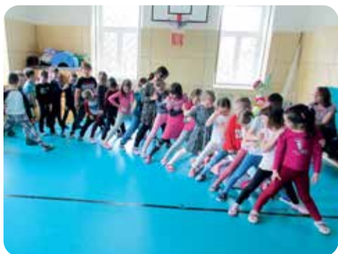
Předškoláci na návštěvě ve škole