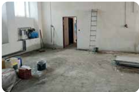
Garáž – vchod do horní části a sušící věže