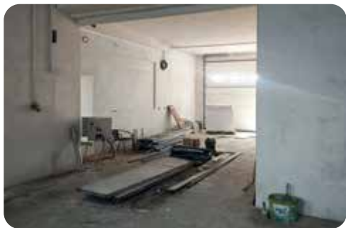
Garáž pro CAS