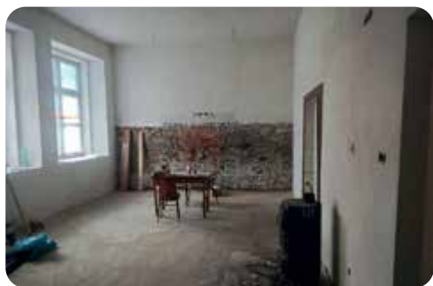
Nová okna v sále