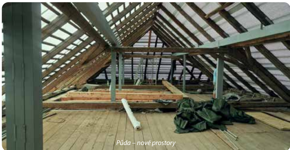
Půda – nové prostory