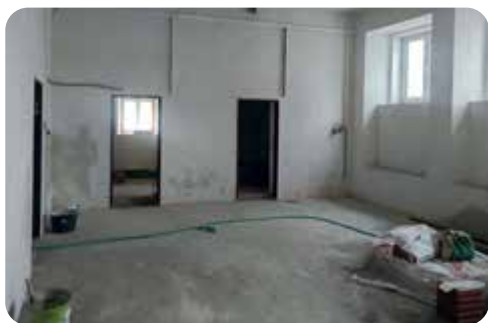
Pohled na sklady dílny