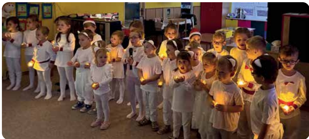
Vánoční besídka v mateřské škole.