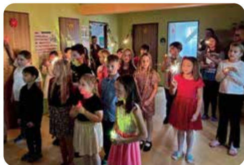
Vánoční besídka v základní škole.