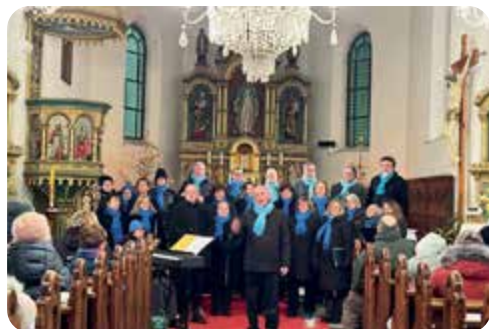
Adventní koncert v kostele.